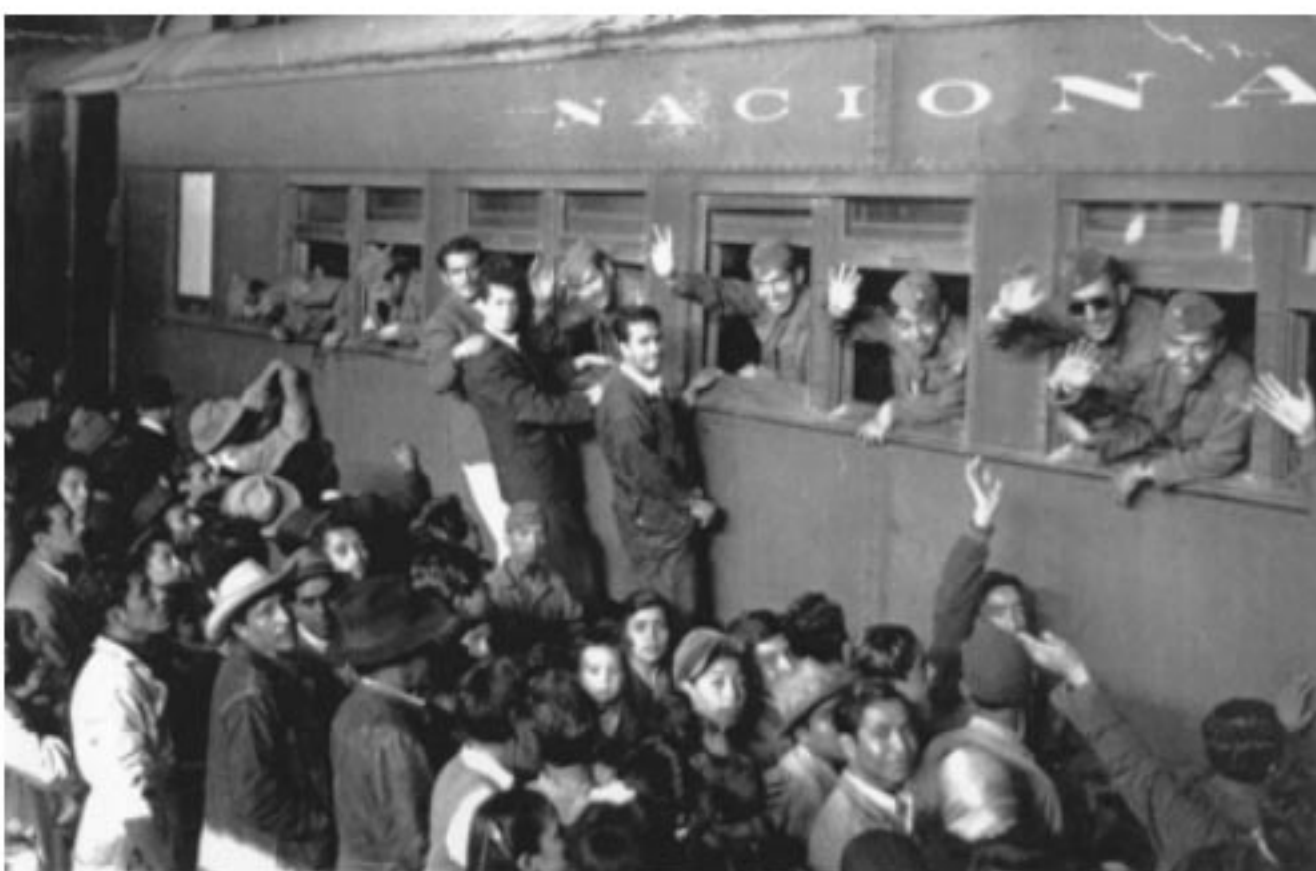
PERSONAL DE LA F.A.E.M. SALIENDO DE LA ESTACIÓN DEL FERROCARRIL, RUMBO A E.U.A.

FUE TRASLADADA A PORAC, PUNTO COMPRENDIDO DENTRO DEL ÁREA DE LA BASE CLARK FIELD, Y ENCUADRADA EL 1/0. DE MAYO EN EL 58/0. GRUPO DE PELEA DEL QUINTO COMANDO DE LA QUINTA FUERZA AÉREA NORTEAMERICANA, QUE A SU VEZ PERTENECÍA A LA FUERZA AÉREA DE LOS ESTADOS UNIDOS EN EL LEJANO ORIENTE.