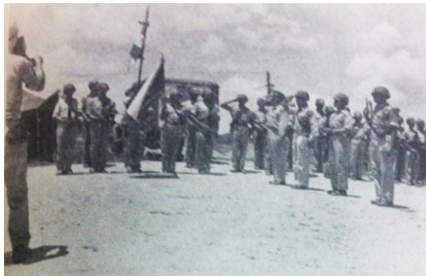
“ESCUADRÓN 201” EN HONORES A LA BANDERA MEXICANA.

EL 2 DE MAYO 1945, POR PRIMERA VEZ SE ONDEA LA BANDERA MEXICANA CON LOS HONORES DE ORDENANZA FUERA DEL TERRITORIO NACIONAL, POR LA FUERZA AÉREA EXPEDICIONARIA MEXICANA.