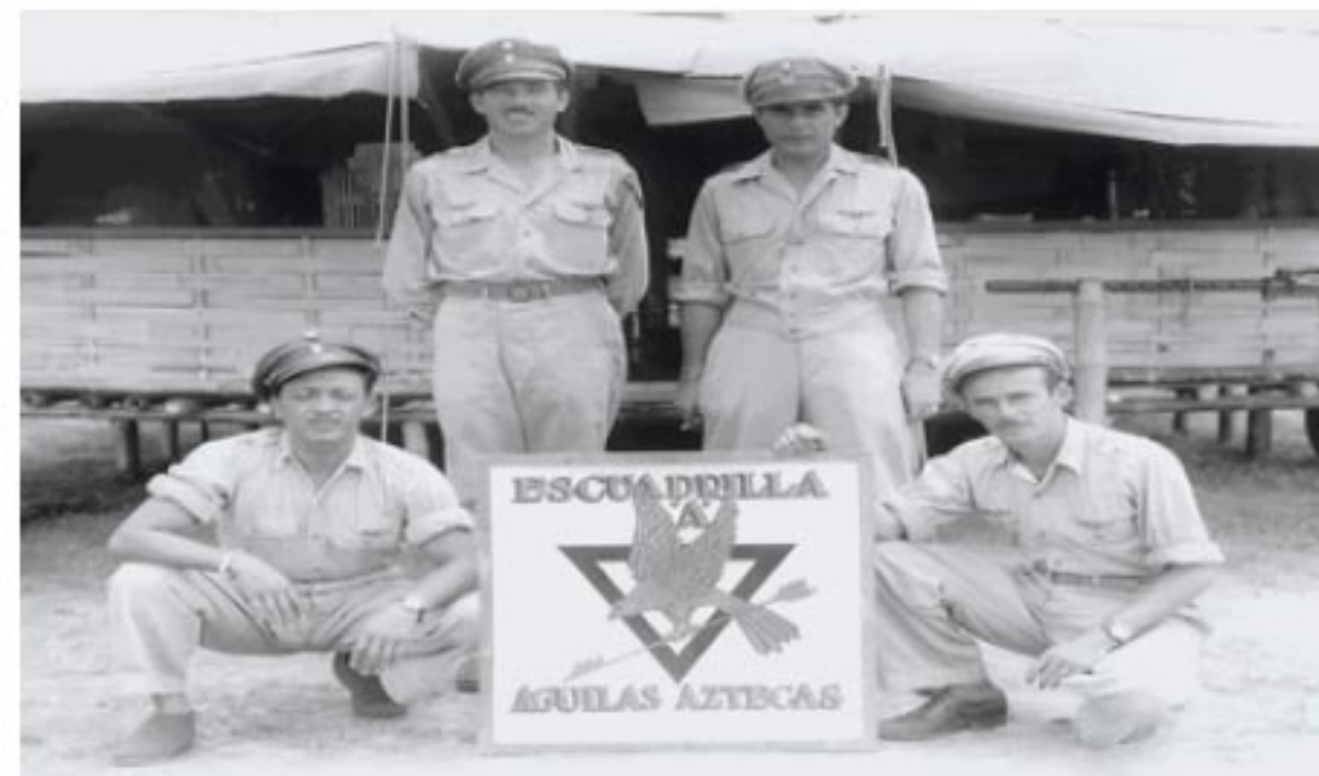
EL “ESCUADRÓN 201”, SE HACIA LLAMAR AGUILAS AZTECAS

EN LOS PRIMEROS DÍAS DEL MES DE JUNIO, EL “ESCUADRÓN 201” DIO FIN AL ENTRENAMIENTO AL QUE FUE SOMETIDO PARA ESTAR EN CONDICIONES DE TOMAR PARTICIPACIÓN EN LAS OPERACIONES.