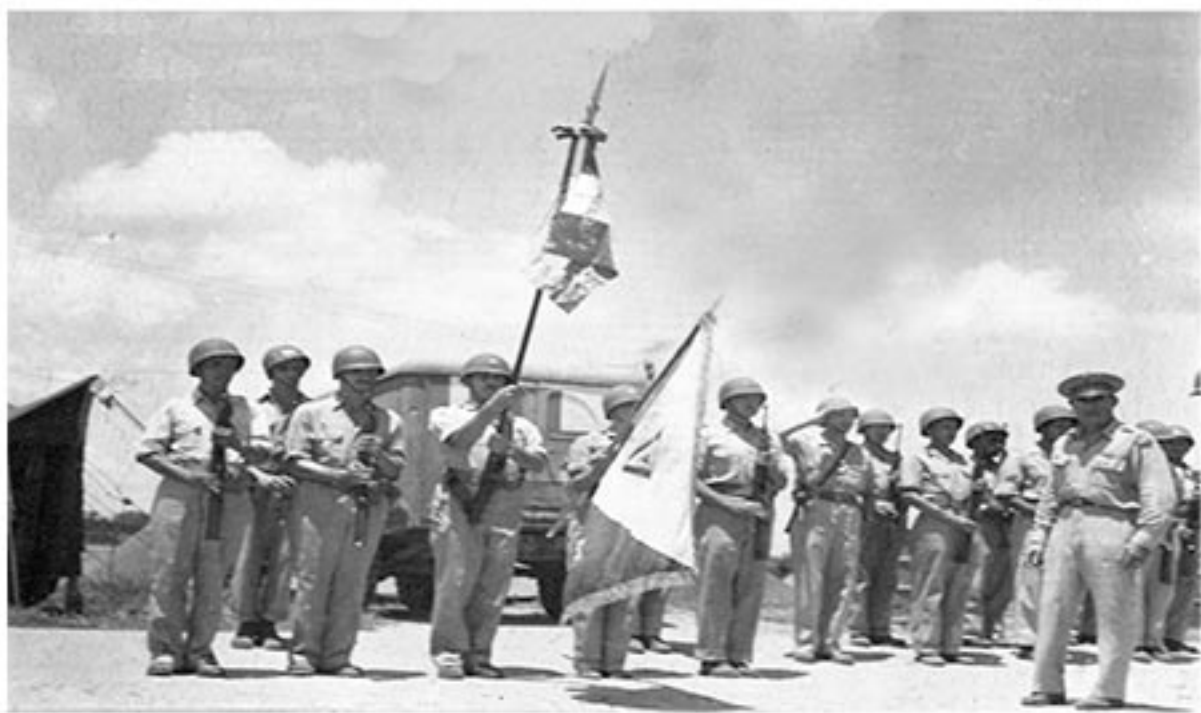
“ESCUADRÓN 201” EN HONORES A LA BANDERA MEXICANA EN FILIPINAS.