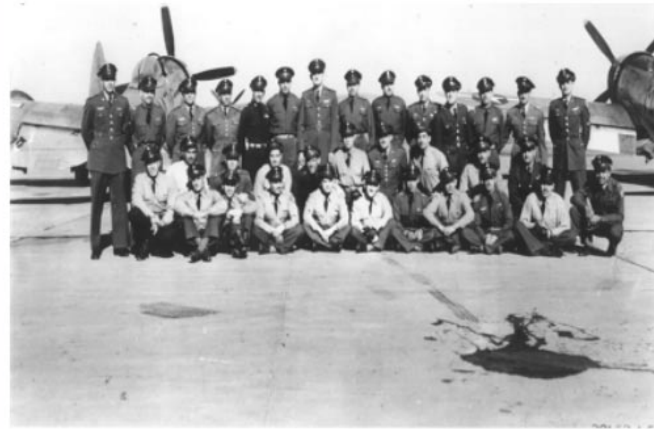
PILOTOS DEL “ESCUADRON 201”.

EL “ESCUADRÓN 201” INTEGRÓ LA UNIDAD DE COMBATE QUE TUVO ACCIÓN EN LOS FRENTES DE LA GUERRA DEL PACÍFICO, DURANTE LA SEGUNDA GUERRA MUNDIAL, “FUERZA AÉREA EXPEDICIONARIA MEXICANA”, COMANDADA POR EL ENTONCES CORONEL PILOTO AVIADOR ANTONIO CÁRDENAS RODRÍGUEZ.