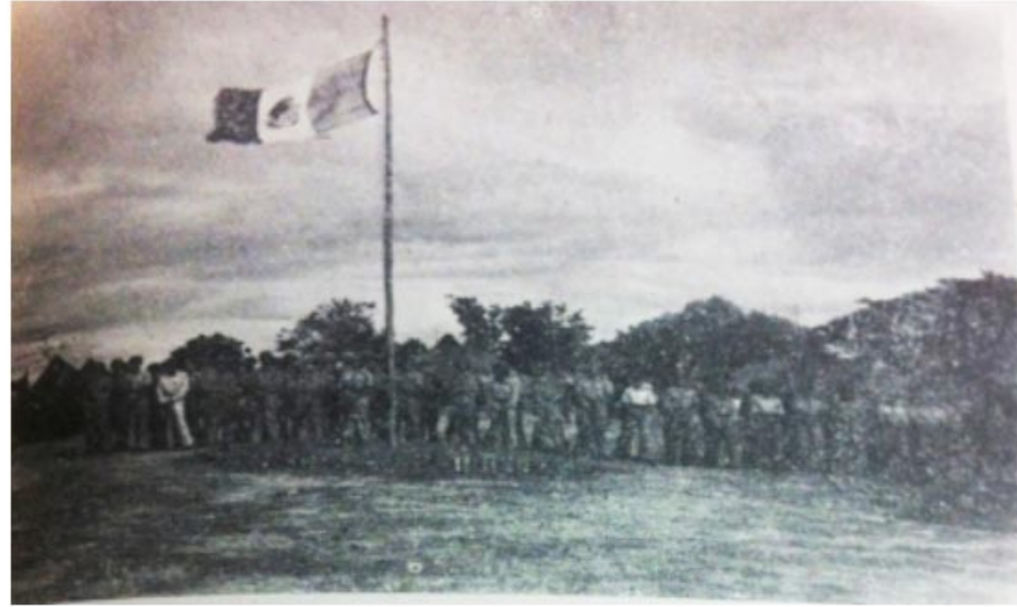
DIARIAMENTE NUESTRA BANDERA ONDEABA EN LUZÓN.

EL QUINTO COMANDO DE PELEA DISPUSO DESDE LUEGO QUE EL “ESCUADRÓN 201” TOMARA UN ENTRENAMIENTO, QUE SE CONSIDERÓ NECESARIO PARA COMPLETAR SU PREPARACIÓN Y ESTAR EN CONDICIONES DE PARTICIPAR EN LAS OPERACIONES, Y ES ASÍ COMO EL DÍA 7 DE MAYO SE INICIA UNA INSTRUCCIÓN TEÓRICA QUE COMPRENDIÓ ILUSTRACIONES SOBRE LA SITUACIÓN MUNDIAL (GUERRA AÉREA EN EL PACÍFICO).